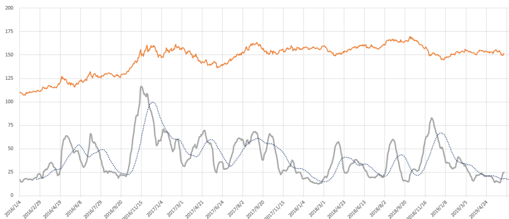
文华商品指数走势与波动率对比