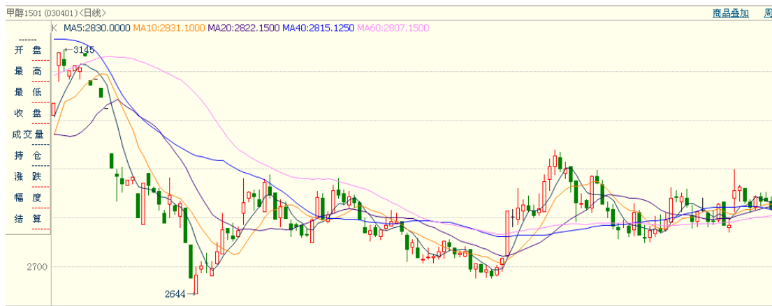
图 1: 甲醇 K 线图